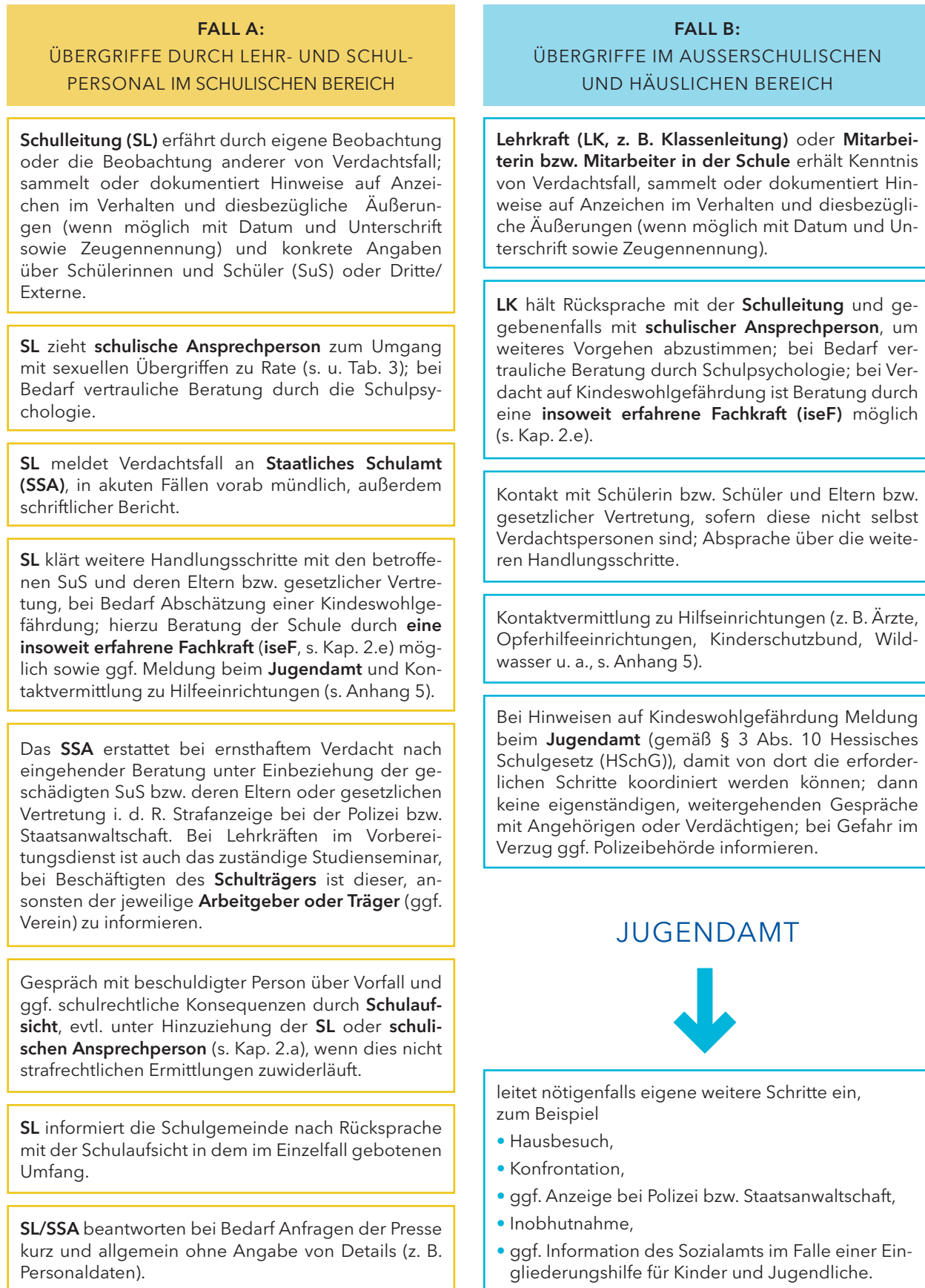
ABB. 1: SCHULISCHE MASSNAHMEN BEI VERDACHT AUF SEXUELLE ÜBERGRIFFE